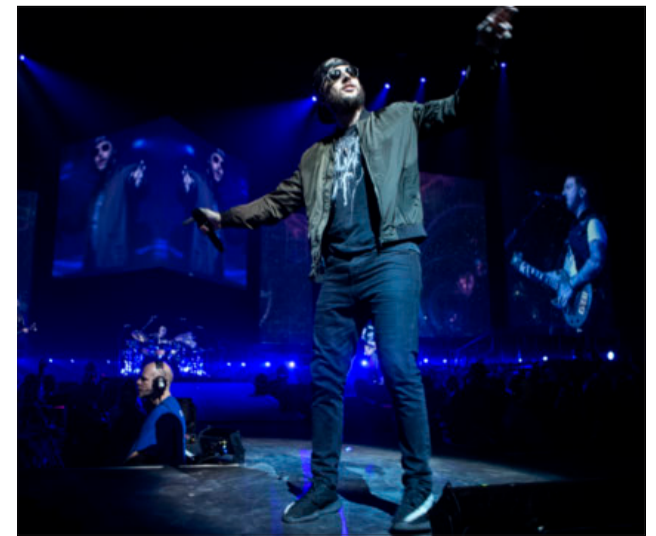
Avenged Sevenfold betog i Royal Arena lytterne med stadion-metal på rumrejse.

Avenged Sevenfold er kæmpestor i slaget og rådyrker det pompøse og op-pustede. Men der er samtidig flot indlagte kontraster i musikken med et mylder af poetiske og nænsomme åndehuller. Det gør alt sammen bandet til et befriende nuanceret bekendtskab inden for en genre, hvor det ellers alt for ofte ender i futtil kappestrid om at være hurtigst og hårdest.